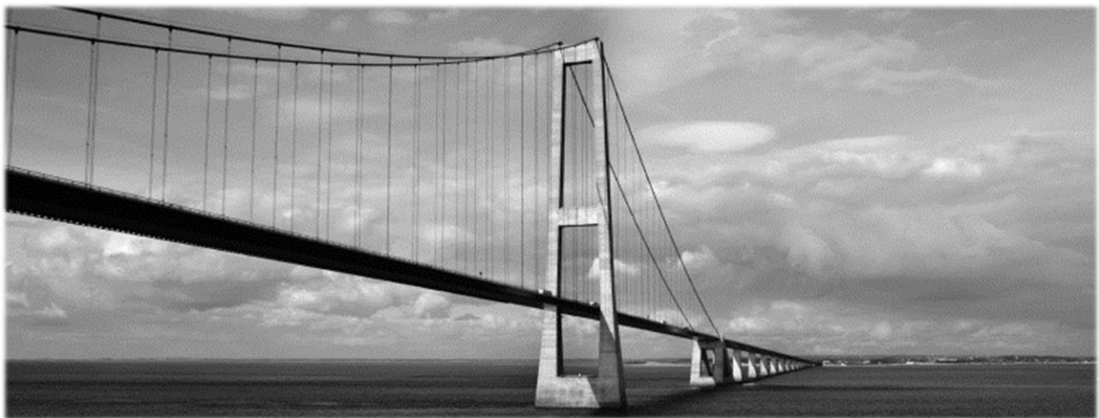
Jeter des ponts